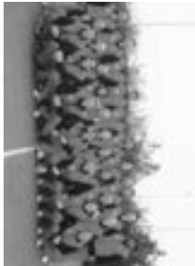
Wanneer start de zomercursus?

Locatie: TV Oosterplas, Oosterplasweg 31, s-Hertogenbosch